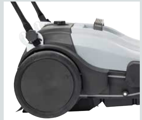
Handtaget kan justeras till passande arbetshöjd(3 lägen)