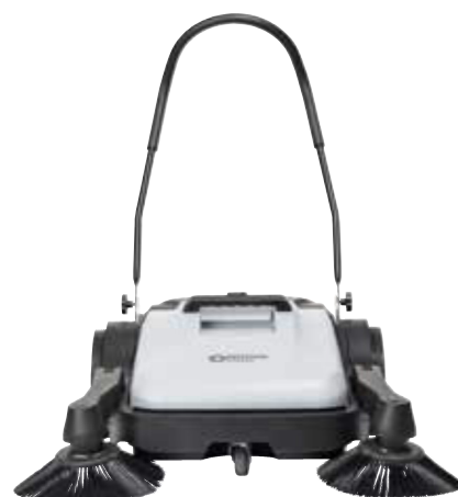
SW200 med en sidaborste – och SW250 med två sidaborstar – med arbetsbredd på 70 cm och 90 cm.

Totalt sett är denna snabba och produktiva sopmaskin från Nilifsk det optimala valet för t.ex. rengöring av mindre fabriker, bilparkeringar, köpcenter, skolor, verkstäder, buss-/järnvägsstationer samt utanför kontorsbyggnader.