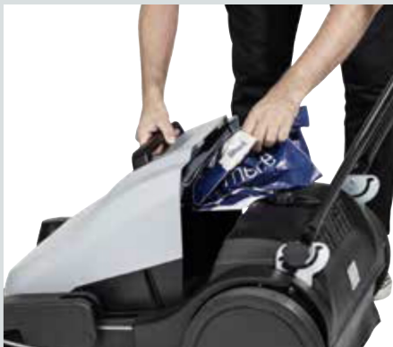
Behållaren kan vara i öppet läge för att enkelt kunna kasta stora föremål eller för att tömma en papperskorgi behållaren