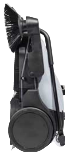
Behållaren hålls på plats även när sopmaskinen placeras för upprätt förvaring eller hängs upp på väggen, tack vare det fällbara handtaget.