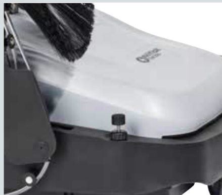
Både huvudborste och sidoborstar kan justeras helt utan verktyg